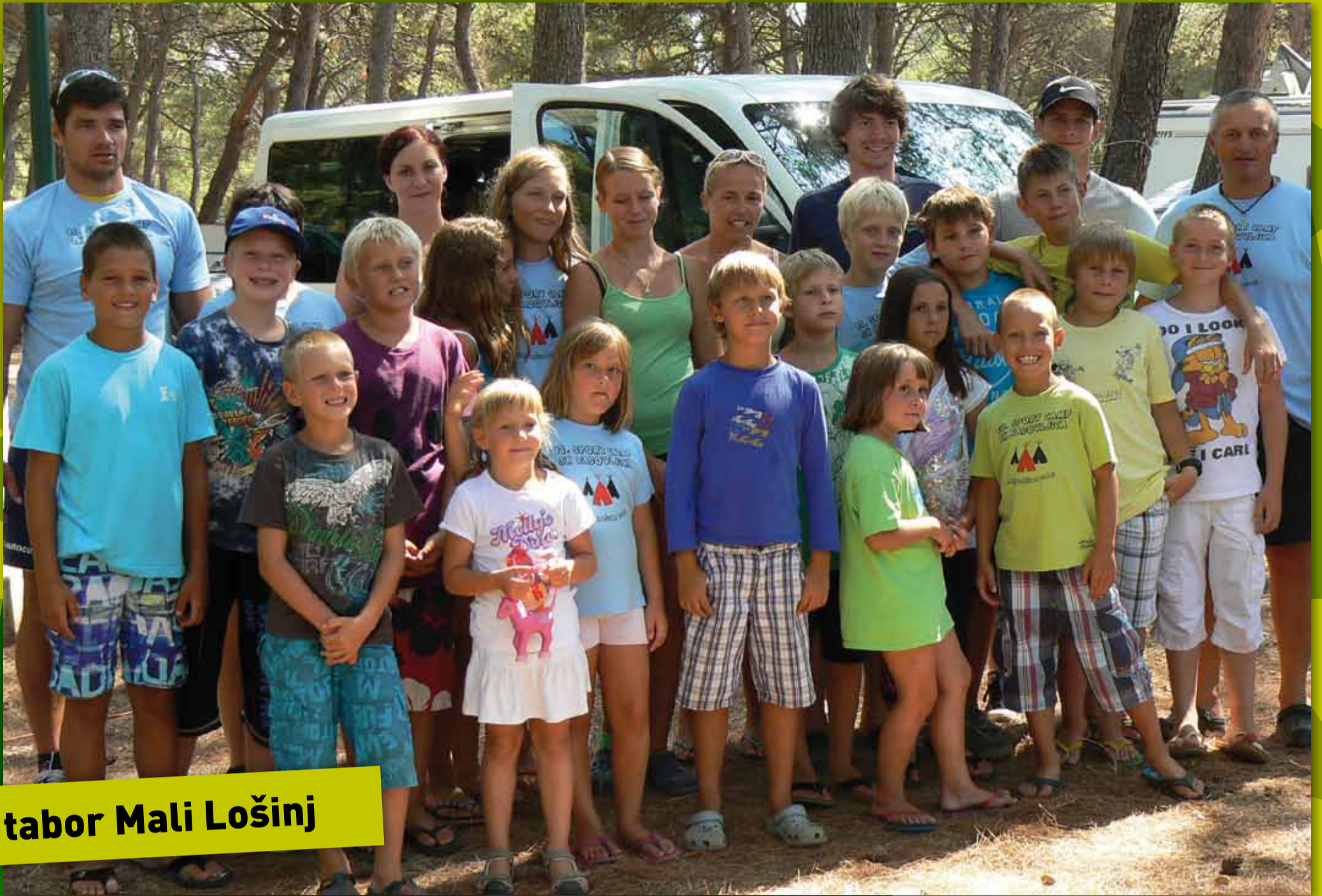
tabor Mali Lošinj