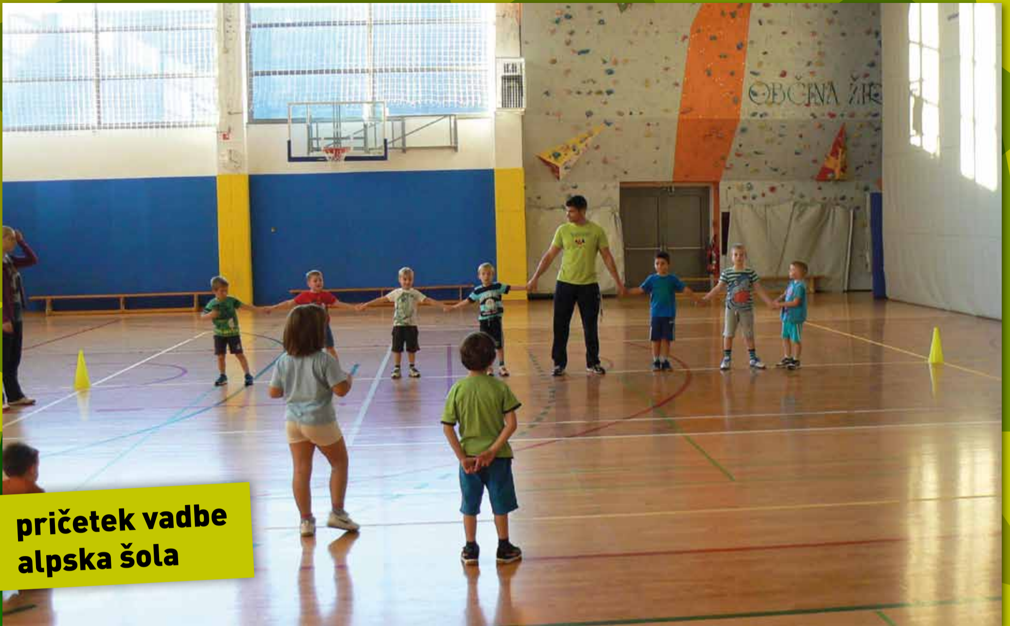
pričetek vadbe alpska šola